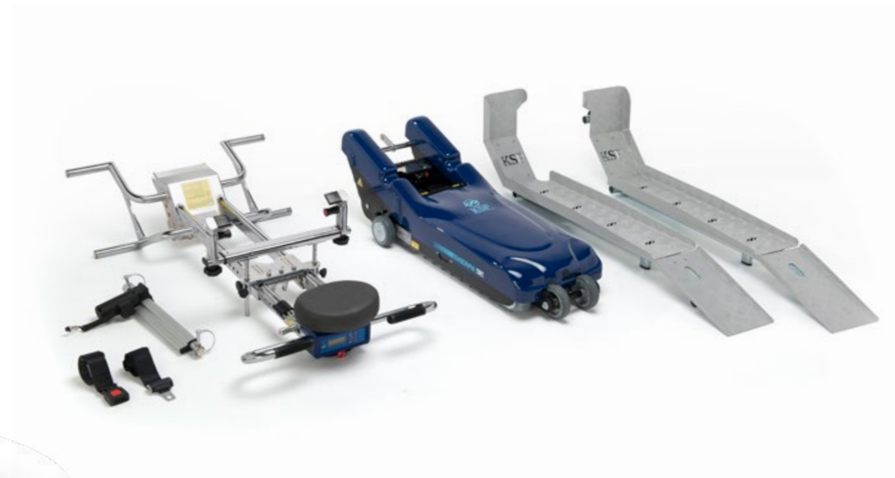
Montascale a cingoli con rampe. Versione Full-optional.