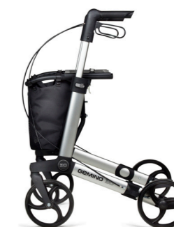
GEMINO 30 parkinson

Rollator dal design ultraleggero. Grande funzionalità alla portata di tutti.