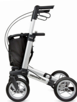
GEMINO 30 comfort