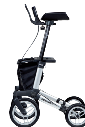
GEMINO 60 walker