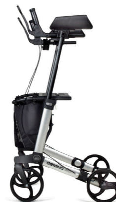
GEMINO 30 walker