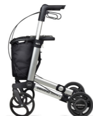
SpeedControl PER GEMINO 30