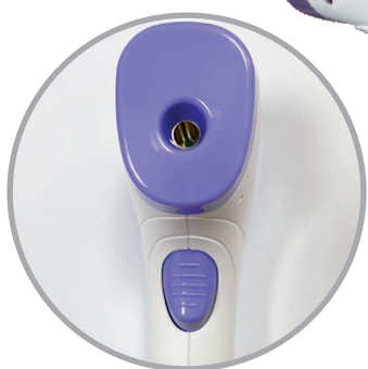
Sensore a infrarossi di fabbricazione Tedesca