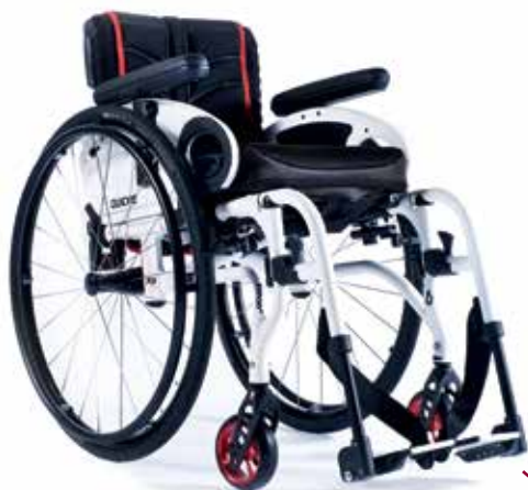
XENON ® SA LA PIÙ ECLETTICA