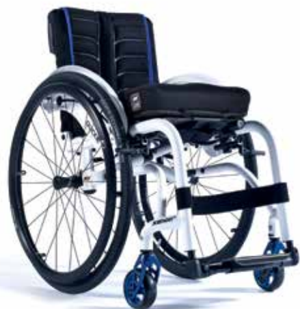
XENON ® HYBRID LA PIÙ RESISTENTE