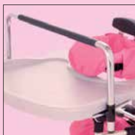
Barra di supporto per giochi per tavolino