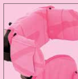
Supporti laterali per appoggiatesta planare