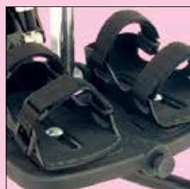
Sandaletti mis.1 Sandaletti mis.2