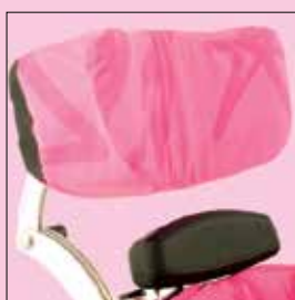
Appoggiatesta anatomico avvolgente