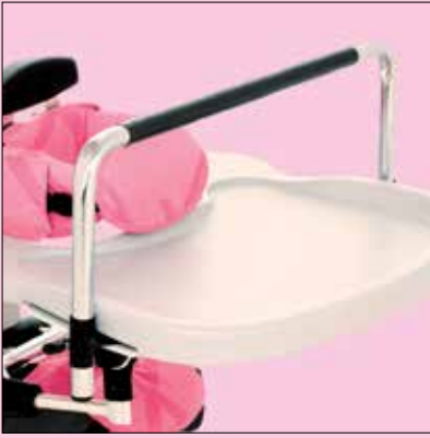
7. Tavolino con barra di supporto per giochi per tavolino