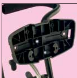
Appoggiatesta planare senza imbottitura