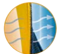
100% COTONE SULLA PELLE

Lo strato a contatto con la pelle è composto da un velluto di cotone 100%, confortevole al tatto, che garantisce alla pelle la libera traspirazione. Lo strato esterno è costituito da una maglia di nylon resistente sulla quale aderiscono perfettamente le bande di velcro del sistema di chiusura.