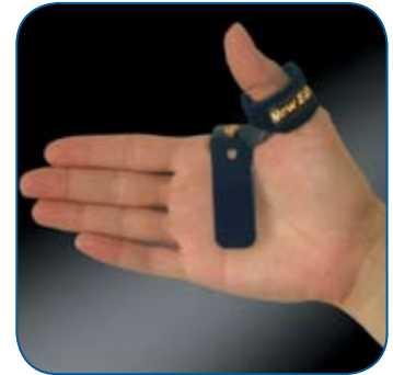
New RIZOFIX System

Innovativo sistema di immobilizzo del pollice RIZOFIX, brevettato a livello internazionale. Esclusivo tessuto anallergico e traspirante, 100% cotone sulla pelle Colore blu.