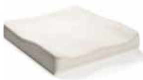
Doppio strato di schiuma sagomata