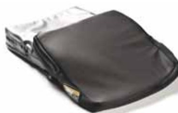
Fodere interna ed esterna