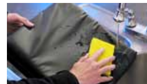
Facile da lavare e da pulire