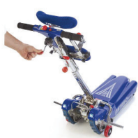
Sblocco timone per facilitare l'aggancio della carrozzina. Unlock steering for easy attachment of the wheelchair.