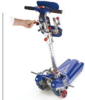
Il timone si alza con facilità e senza sforzo. The rudder is raised easily and effortlessly.