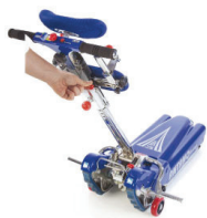
Rimozione blocco di sicurezza meccanico/elettrico ghiera timone. Remove safety lock mechanical / electrical steering wheel.

Un nuovo sistema di sgancio dall'alto, che permette all'utente di agganciare la carrozzina senza sforzo e senza movimenti con i piedi. A new release system that allows the wheelchair to hook easily and without effort to the handlebar.