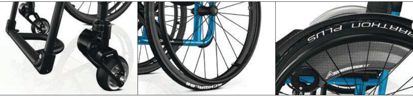
Le forcelle ammortizzate Froglegs per le ruote anteriori, migliorano decisamente il comfort di guida, grazie all'efficace assorbimento delle sollecitazioni sui percorsi più accidentati.