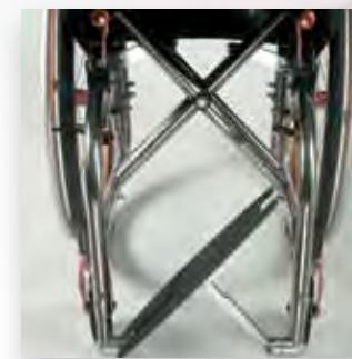
Pedana a chiusura automatica. Automatic closure foot-rest.