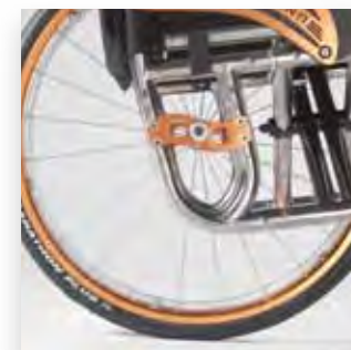
Piastra dinamica porta ruota HwP. HwP dynamic wheel plate.