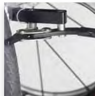
Freno a scomparsa. Scissor brake