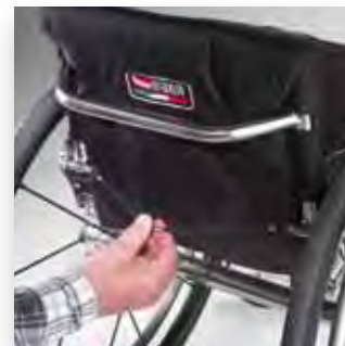
Schienale abbattibile e regolabile in inclinazione Folding down and tilt adjustable back-rest