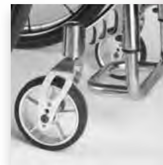
Forcella sagomata anteriore Front fork