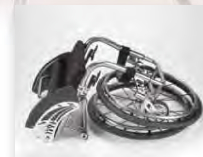
Minimo ingombro. Takes up less space